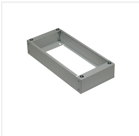
WIDOK COKOŁU DO RWX